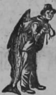
Con esta marca.

es única en su clase. Sus virtudes extraordinariamente curativas justifican nuestro consejo: